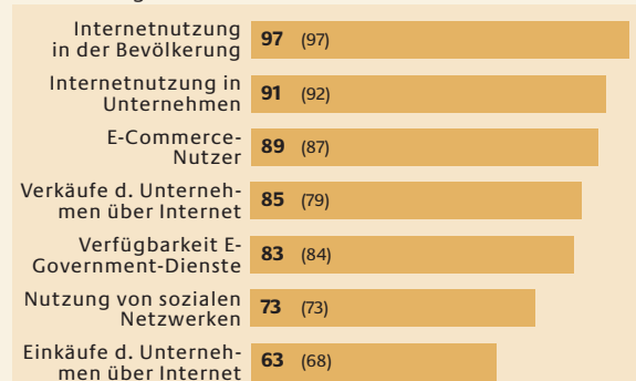
Abb.: Reifegrad der niederländischen Anwendungen, 2008 Durchweg überdurchschnittliche Performance im Teilbereich „Anwendungen“

Quelle: TNS Infratest (2009); Vorjahreswerte in Klammern