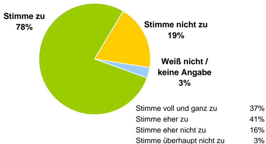
“Umweltprobleme wirken sich unmittelbar auf mein tägliches Leben aus” Anteil in EU 27