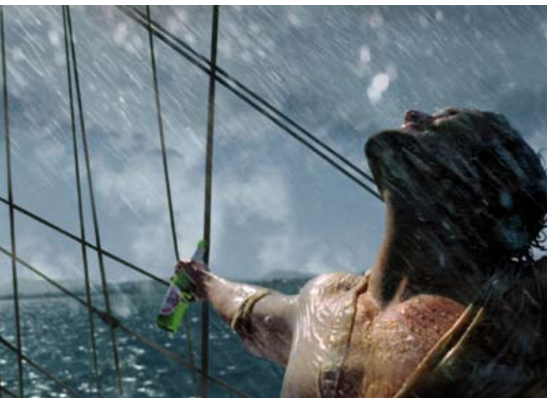
Kommunikativer Besitzstand: Sehnsucht nach der Sehnsucht

Aber eine Marke wie Fisherman's Friend besitzt etwas, das sie von vielen anderen Marken unterscheidet: einen kommunikativen Besitzstand. Mit diesem Begriff bezeichnen wir ein (in der Regel) über einen längeren Zeitraum erworbenes, hart erarbeitetes Portfolio von Symbolen und Zeichen, Bildern, Jingles, Dramaturgien, Claims oder anderen Elementen, die aus der Marke stammen können, für die Marke erworben wurden und die die Marke unverwechselbar repräsentieren. Kommunikativer Besitzstand ist das Ergebnis von kontinuierlicher Markenkommunikation, die über die Zeit (und über viele Kampagnen) mit kohärenten Elementen die Konsistenz des kommunikativen Markenbildes gewährleistet hat. In der Regel wurde dabei das Prinzip der Selbstähnlichkeit der Marke gewahrt.