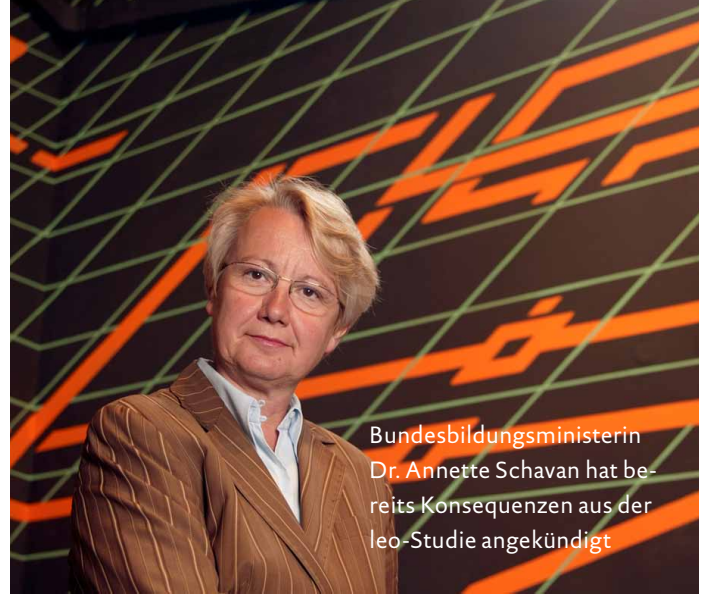
Bundesbildungsministerin Dr. Annette Schavan hat bereits Konsequenzen aus der leo-Studie angekündigt

Von Bedeutung war dabei zum einen, die Studie an den Adult Education Survey anzugliedern – eine Befragung zu ihren Schreib- und Lesefähigkeiten hätten viele Betroffene sicher von vornherein abgelehnt. Zudem wurde in der Face-to-Face-Befragung jegliche Schriftsprache vermieden. Schließlich „tarnte“ ein Rätselheft die Erfassung der eigentlichen Lese- und Schreibfähigkeiten. Im Rahmen der Studie wurden mehrere Kompetenz-Niveaus unterschieden: Auf Level 1 und 2 haben Betroffene bereits Probleme, Buchstaben und Wörter richtig zu deuten – 4,5 Prozent der erwerbsfähigen Bevölkerung. Weitere zehn Prozent können zwar einzelne Sätze lesen, sind aber selbst bei kürzeren Texten überfordert und können so nur begrenzt am gesellschaftlichen Leben teilnehmen. Level 1 bis 3 werden zusammengefasst als funktionaler Analphabetismus definiert. Erschreckend ist auch die Tatsache, dass ein weiteres Viertel der Bevölkerung deutliche Rechtschreibschwächen aufweist und damit etwa auf Grundschulniveau liegt. Ein großes Lob sprechen die Autoren dem Face-To-Face Interviewerstab aus: „Ohne unsere Interviewer, die zu Hause mit den Zielpersonen Lese- und Schreibtests gemacht haben, hätten wir diese Studie nie machen können.“ Ursprünglich sollte leo.-Level One nur als Pilotstudie veröffentlicht werden. Das Bundesministerium für Bildung und Forschung hat die Ergebnisse dann aber als so valide eingestuft, dass man auf dieses Attri-